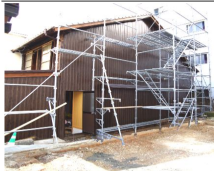
市の計画で復旧工事が進んだ織屋。手前の空き地はレンガ倉庫の跡地