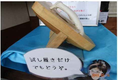
小平選手にならい一本歯の下駄でトレーニングしてみませんか? 中町のホリッシュ