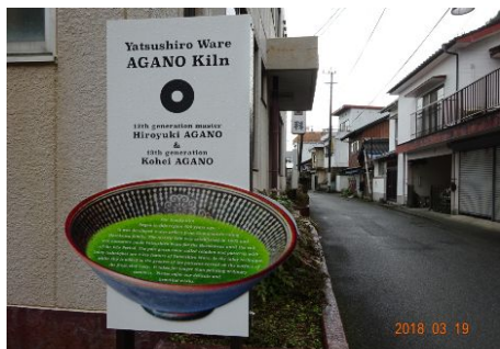
インパウンド(訪日外国人旅行)の方々へのおもてなし看板。日奈久の魅力どうぞ。