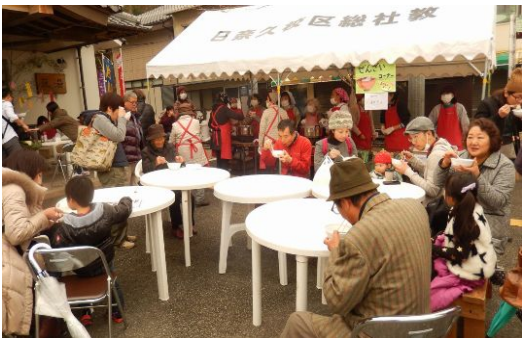
婦人会による300食の雑せんざいは大人気。