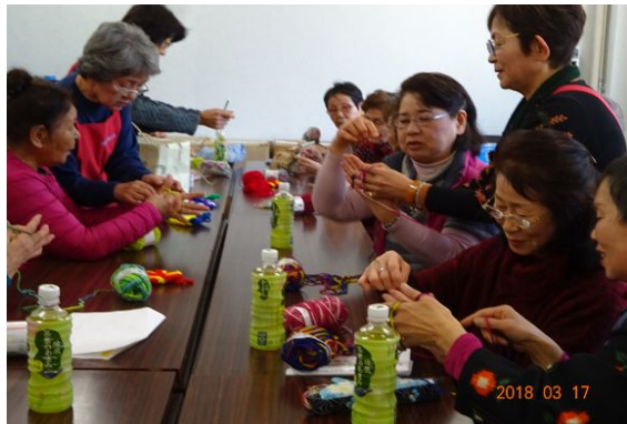
ワイワイ楽しくアクリルたわし作り

日奈久コミュニティセンターは、住民の要望に応じて洋式トイレが増えました。女性用2・3階、男性用3階に洋式トイレを設置する工事が完了しました。この工事費の一部はJRAからの寄付金が使われました。3月17日(土)、「日奈久コミュニティミニ集会」が行われ、約50名の住民が集まり、楽しく交流しました。「みんなで歌いましょう」「抹茶でほっこり」「かぎ針や手編みでのアクリルタワシ作り」に笑い声一杯の時間でした。婦人会・スプリングコールの皆様のご協力有難うございました。